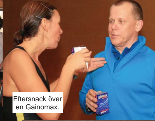
Eftersnack över en Gainomax.