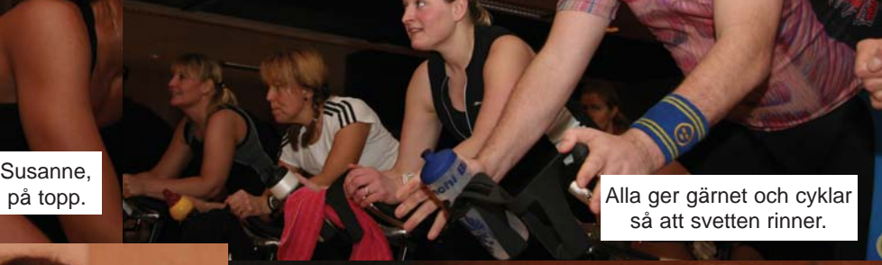
Alla ger gäret och cyklar så att svetten rinner.