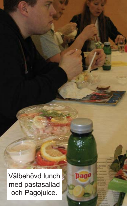
Välbehövad lunch med pastasallad och Pagojuice.